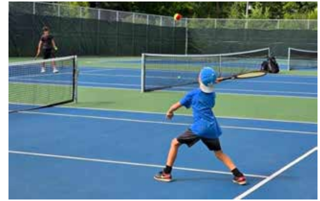
The Wychwood Tennis Club is expanding to the newly built courts at Parc Paul-Pelletier this season as it approaches its 100th anniversary in 2028.

For much of its history, the club held an exclusive right to the courts at Parc Tourbillon in the Wychwood neighbourhood, an arrangement that set it apart from other clubs in the region. That exclusivity is now ending. Under a new agreement with the City of Gatineau, the courts will be open to all residents when no club activities are booked. It is a significant shift, but Tremblay frames it as a natural evolution rather than a loss. "The purpose is to be a partner with the city," he said, noting that the two had maintained an excellent working relationship for several years. The membership debated the change at a special meeting last year and concluded that broader access served the community better than exclusivity.