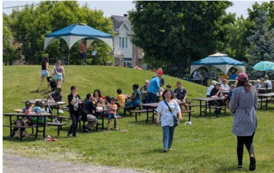
The Deschênes residents association is going dormant for up to a year after failing to find new board members, putting neighbourhood events like the Fête des voisins on the chopping block.